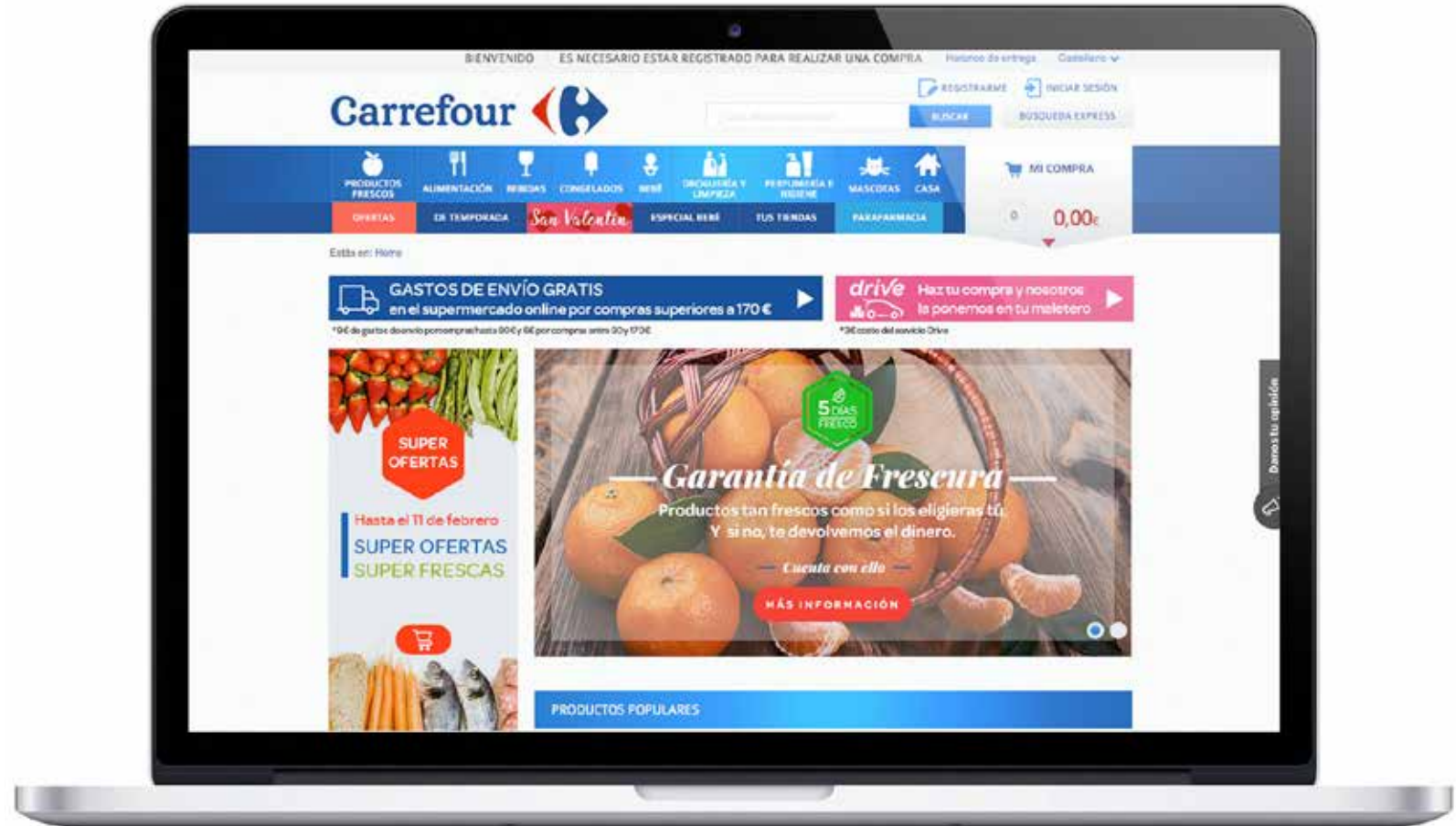
Página de inicio de Carrefour

Pero siguen arrastrando problemas de la antigua página web y la tecnología soportada, ya que hay formularios mejorables, validaciones en local y no en servidor que eliminarían estrés de sus clientes y sobre todo se echa en falta la versión responsive del site, que esperemos no tarden mucho y que el esfuerzo realizado no se eche a perder.