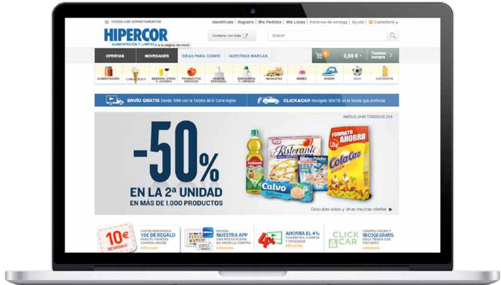
Página de inicio de Hipercor.

En cuanto a experiencia del cliente, Hipercor se mantiene dentro de la categoría de supermercados que no se consideran preferentes para realizar su compra online.