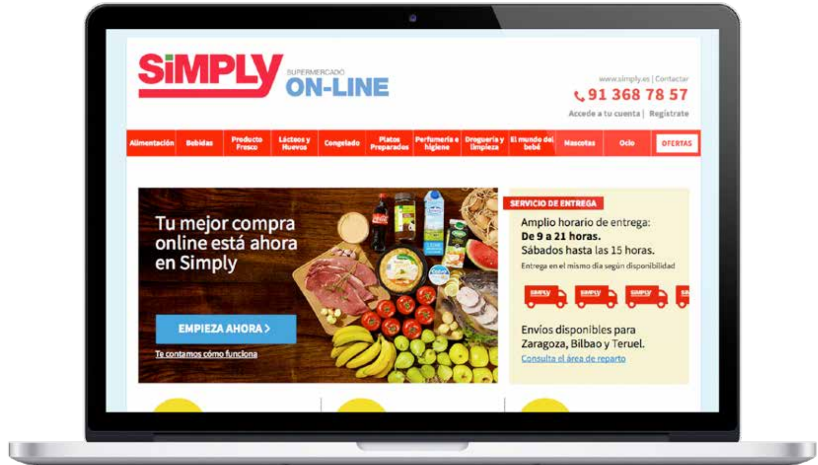
Página de inicio de Simply.

Haciendo honor a su nombre, nos ofrecen la experiencia de compra más sencilla.