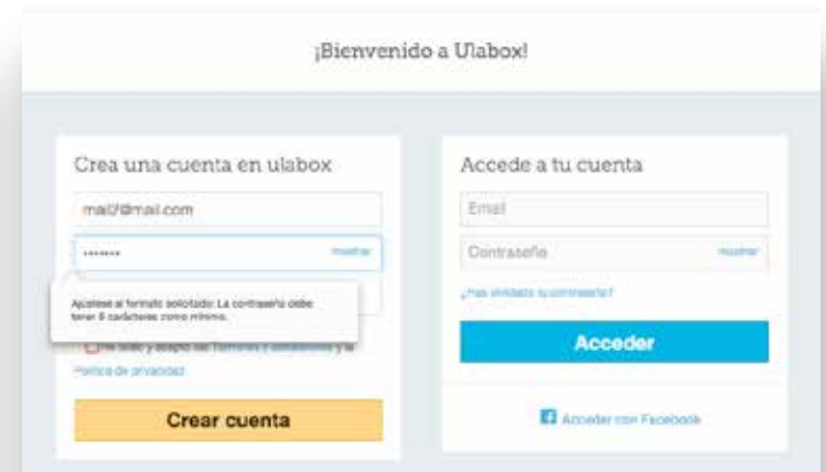
Figura 2. La información sobre cómo se ha de rellenar el campo contraseña aparece una vez que el formulario ha sido enviado.