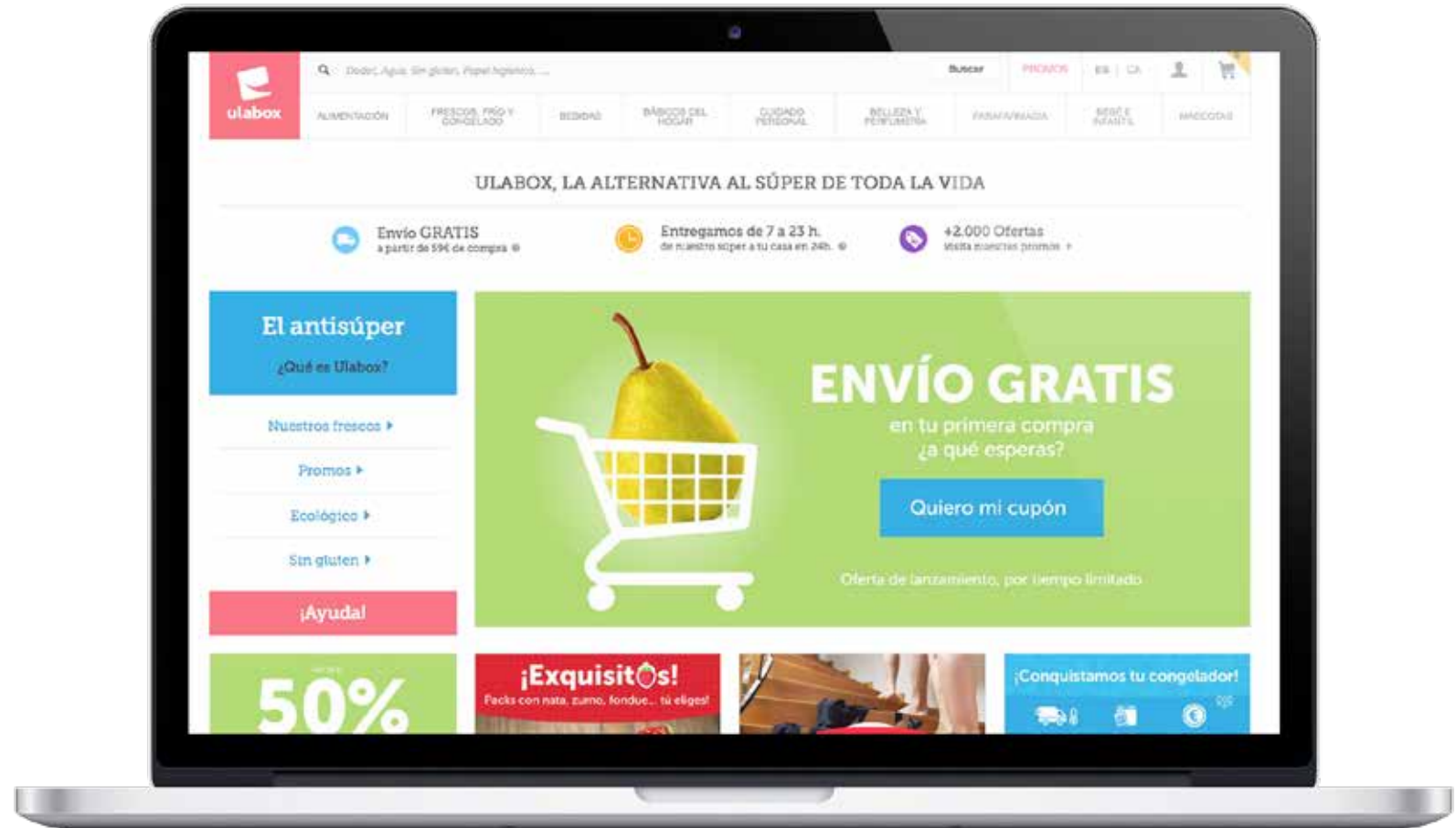
Página de inicio de Ulabox.

Como líder en experiencia de cliente, Ulabox hace partícipe al usuario de cualquier sugerencia, necesidad o comentario que puedan ayudar a mejorar, así como proponer productos que no forman parte de sus catálogo. Como lado negativo, Ulabox suspende en el reparto de productos frescos ya que solo abarca el área metropolitana de Barcelona.